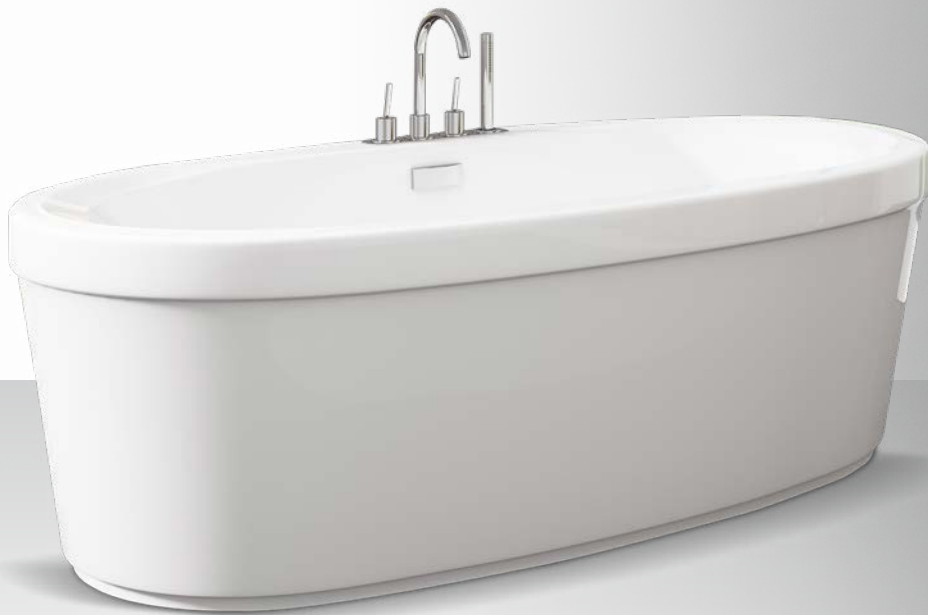
Brooke Reveal | mirolin